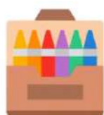
Lápices de colores