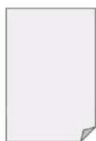
Hoja de papel

Para la actividad de esta semana necesitarás lo siguientes materiales, fáciles de encontrar en casa: