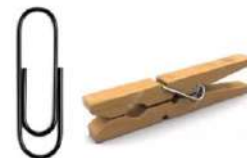
Un clip o un perro de ropa

Te preguntará para qué son estos materiales, pues esta semana fabricaremos un ¡Emociómetro!