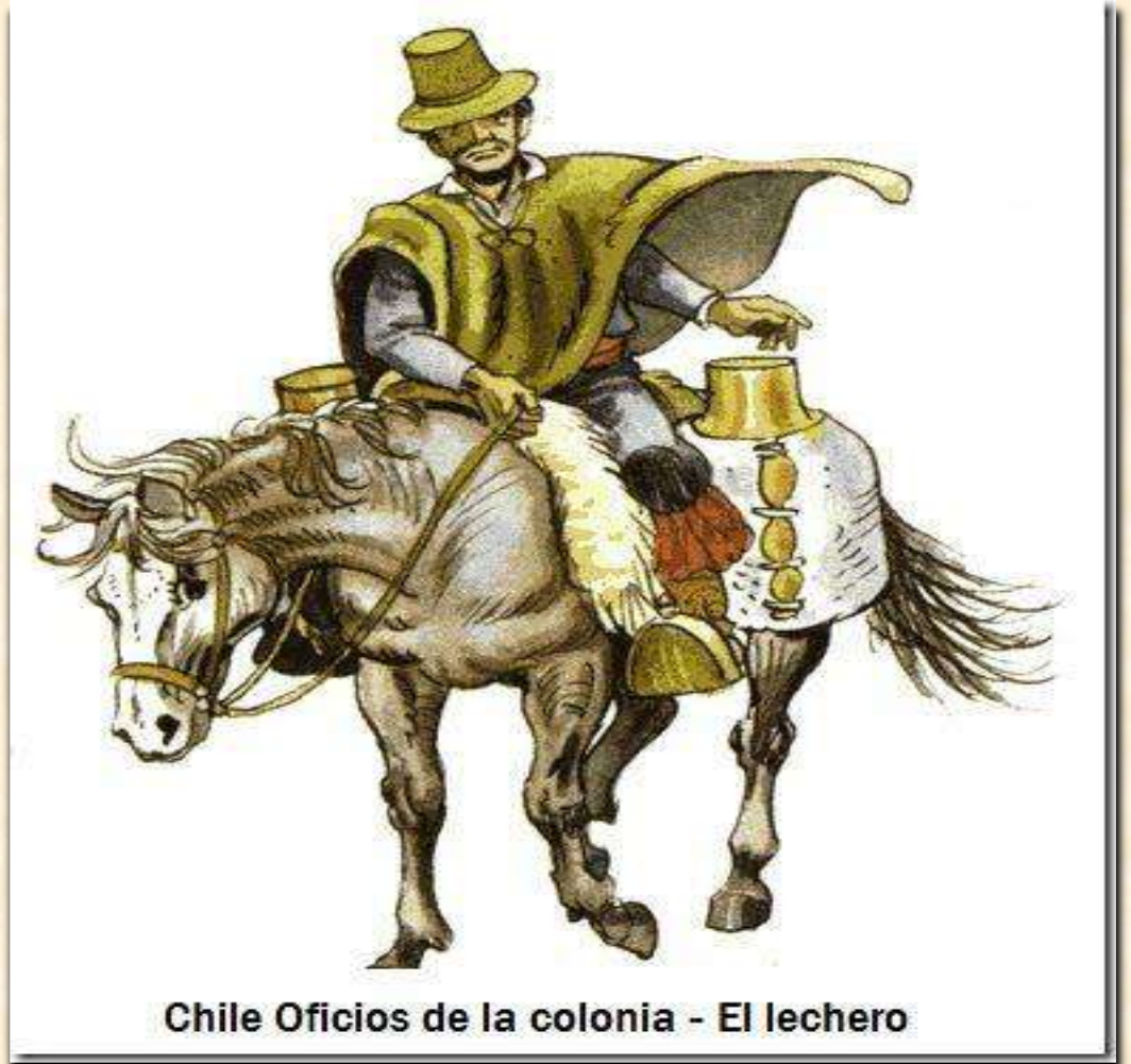
Chile Oficios de la colonia - El lechero

El lento, pero sostenido crecimiento demográfico de algunas ciudades como Santiago que a fines del siglo XVIII albergaba a más de 17 mil personas, o de Concepción que en la misma época alcanzaba a más de 9 mil habitantes, aumentó las necesidades de abastecimiento de dichas ciudades. Así, se desarrolló el comercio ambulante que tuvo gran importancia: los vendedores recorrían las calles de las ciudades ofreciendo una gran diversidad de productos: agua, hielo, velas, pan, leche, entre otros.