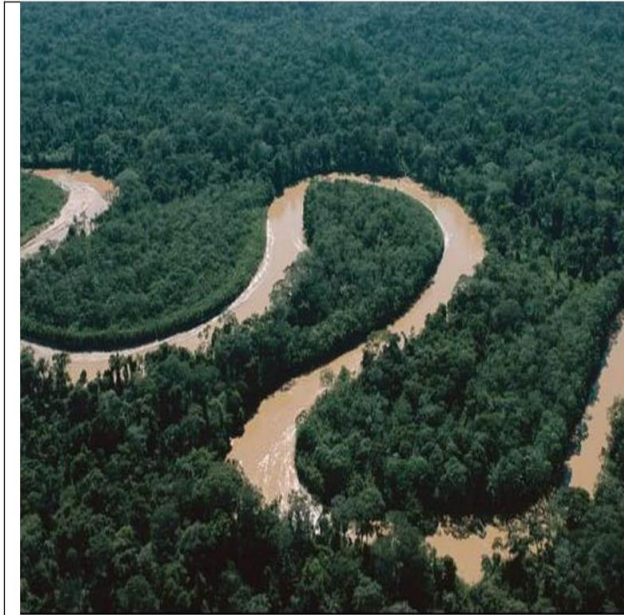
Cuenca del Amazonas

Observa las imágenes y responde las preguntas las preguntas 3 y 4