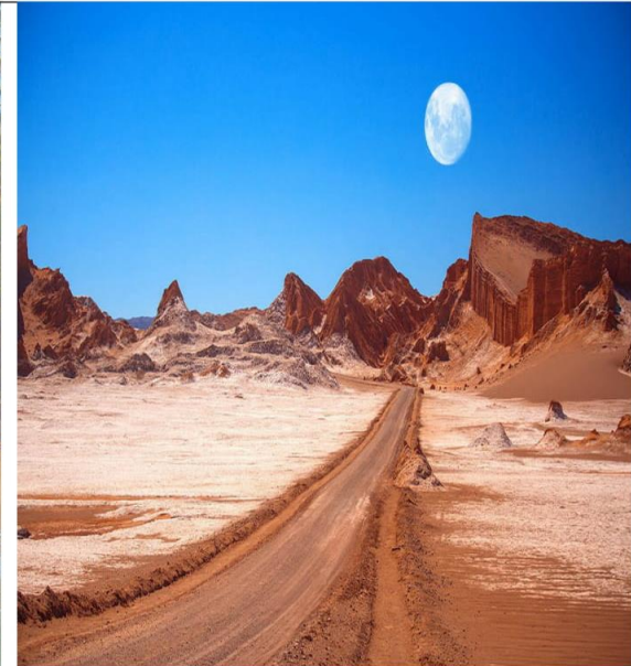
Desierto de Atacama