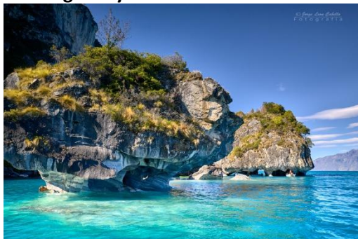
La Patagonia y la catedral de mármol