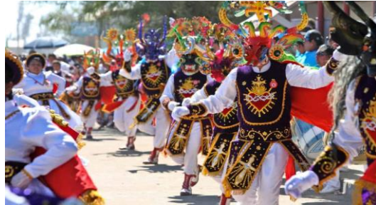
La fiesta de la tirana