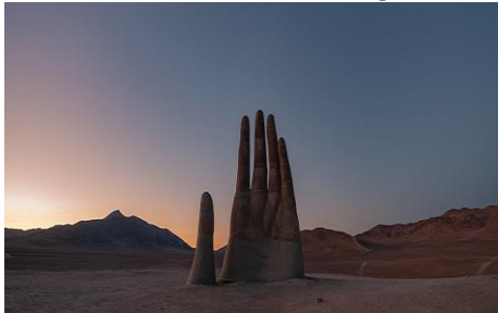
La mano del desierto Antofagasta