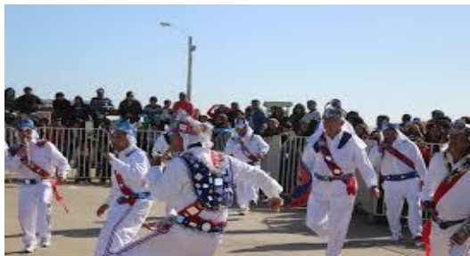
FIESTA DE SAN PEDRO DE LOS VILOS