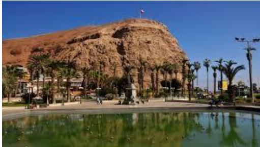
Morro de Arica