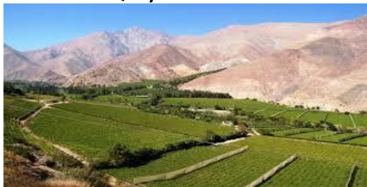
VALLE DEL ELQUI y valles transversales