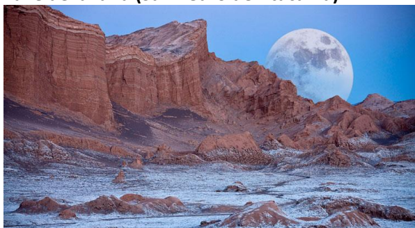
Valle de la luna (San Pedro de Atacama)