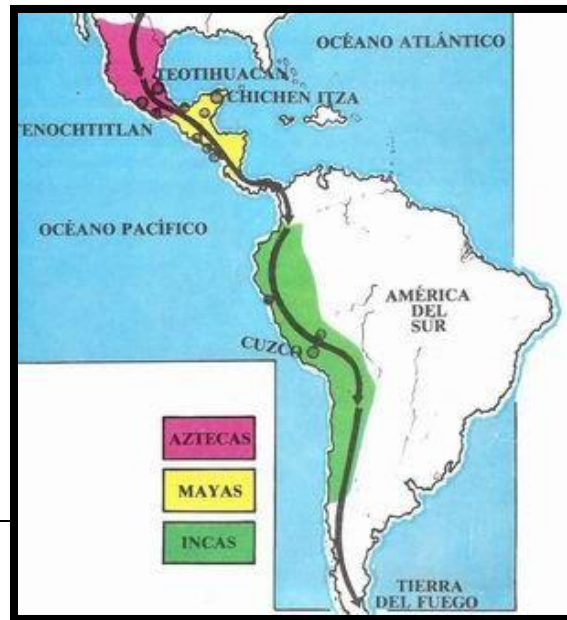
MAPA N° 2