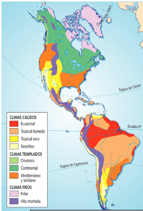
Mapa de Climas y sub-climas de América